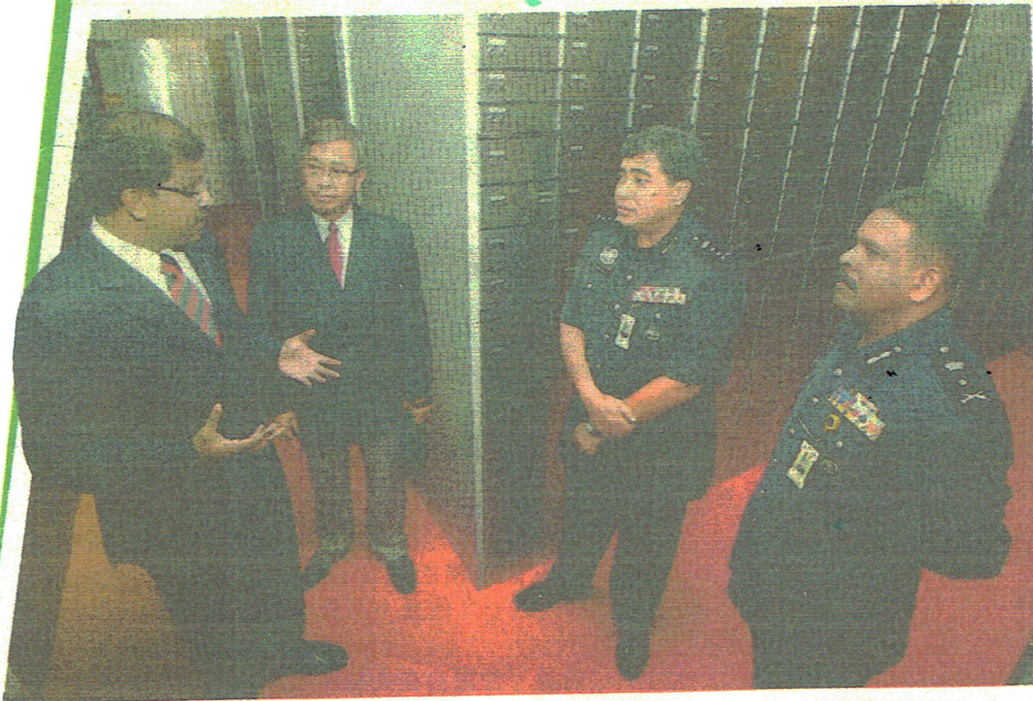
雪州副总警长拿督达威甘卡立(右起)、卡立一起聆听保险箱公司的管理人员的保安措施建议。

较早前的消息指出，警方将陆续传召曾和赵明福有联络的人士录取口供，以取得更多线索，而警方的传召工作目前仍未结束。